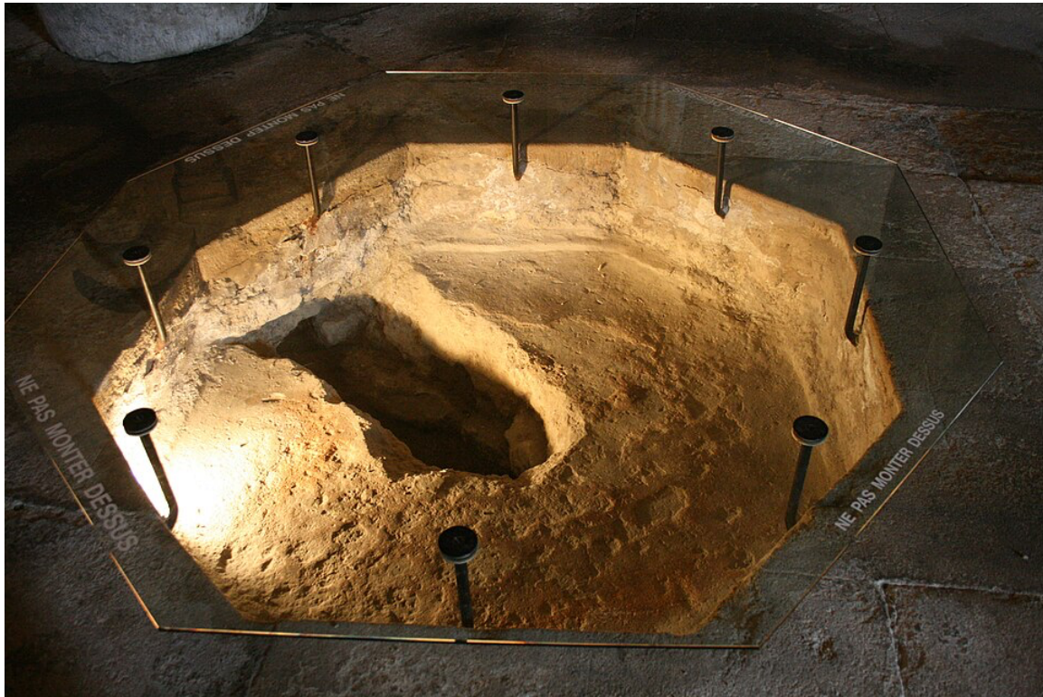
Baptistère Saint-Jean à Poitiers (Poitou), IV ème siècle — Le plus vieux conservé en France :